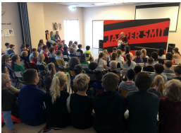
4213 leerlingen bezochten een voorstelling

Tijdens de Kinderboekenweek bezochten leerlingen theatervoorstellingen in zalen, theaters en buurtcentra in de gemeenten Lochem en Zutphen. 4 verschillende gezelschappen traden 29 keer op voor de kinderen uit de onder-, midden- en bovenbouw. In totaal bezochten 2554 leerlingen de voorstellingen.